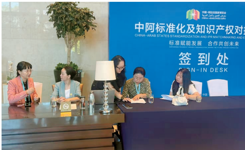
▲ 自治区纪委监委驻商务厅纪检监察组围绕节俭高效办会、安全生产责任落实等办会要求强化监督检查。

中阿博览会各类签约项目落地见效。通过“会后复盘+经验总结+互动交流”等方式，督促自治区商务厅围绕中阿博览会预算编制、绩效目标设置、资金拨付、招投标项目等方面，聘请第三方审计机构开展财务审计及绩效评价，确保财政资金精准使用，提高市场化办会能力，为持续深化中阿共建“一带一路”国家经贸合作平台夯实基础。针对博览会具体工作推进、