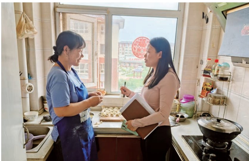
▲ 驻村队员入户宣讲 2025 年巩固拓展脱贫攻坚成果同乡村振兴有效衔接帮扶政策，发放、张贴“脱贫户帮扶明白卡”。

清晨六点，凉风习习，鸟鸣如泉，大多数人还在睡梦中，“等活”的人已经在镇河塔零工市场或站或蹲，他们身着迷彩服、劳保服，戴帽子、裹头巾。46岁的马大哥蹲在角落，攥着半块馒头，嘴唇干裂，“今年活少得很，两个娃上职高，学费还没着落呢”。他们由于文化水平低，没有一技之长，难以在企业长期就业，就只能外出务工干体力活。他们聚拢到一起，边吃馒头饼子边聊天，一直到八点半左右，如果没有人找他们，他们就只能默默回家。他们主要在工地上当小工，也有些去宁东当绿化工，还有些抱瓜装车。女性一天110元左右，干得多一些，能挣到140元左右，男性一天220元左右，多的有240元，但能不能等到活全凭运气。跟往年比，今年形势不好，开工的工地较少，用工需求量下降，情况好的每个月能干上二十来天，有些运气差的也就能干上十来天。一旦遇到雨天，就只能望雨兴叹，而今年夏天雨天还比较多。秋天一过，天冷了，就基本无工可打，像“农闲”时一样，人就“闲”下来了。