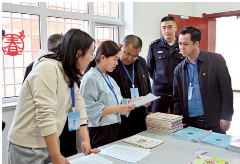
▲ 中卫市委第三巡察组巡察中卫市公安局党委时，实地检查预防和打击未成年人犯罪情况。

跟踪督办、提级查办、集中调度等集中整治好经验好做法，紧盯乡村振兴、惠民富民、共同富裕等方面政策措施落实，切实解决群众反映强烈的突出问题。今年以来，新增集中整治相关问题线索975件，立案272人，给予党纪政务处分212人，移送司法机关14人，以有力有效的案件查办把集中整治不断引向深入。聚焦中小校园食品安全和膳食经费管理、农村集体“三资”管理、乡村振兴资金使用监管、医保基金管理、养老服务等领域扎实开展专项治理，推动职能部门整改问题1315个，纪检监察机关给予党纪政务处分118人。围绕全国集中推进的16件群众身边具体实事，借助“三进民企”活动，推动相关职能部门着力解决国企项目欠薪、骗取套取社保基金、涉企执法多、重复医疗检查检验等群众关心关注的民生实事，为540名劳动者追回劳动报酬500.3万元；追回违规领取社保基金152.99万元；纠治重复医疗检查检验、违规收费问题62类946个，推动全市11家二级及以上医疗机构实现十大类361个