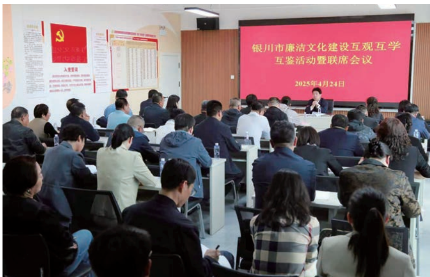
▲ 银川市举办廉洁文化建设互观互学互鉴活动暨联席会议。

“静”变“动”，廉洁教育“扫码即学”“云端共享”；线下依托全市历史人文古迹、革命遗址遗迹等场馆，广场、公园等公共休闲服务空间，打造提升和整合市、县（区）、乡镇（街道）、村（社区）4级35个廉洁文化教育阵地，系统梳理各层级廉洁文化教育阵地，分类别、分功能统筹规划6条廉洁教育观摩学习线路，推进