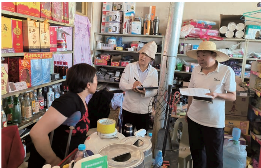
▲ 海原县委第四巡察组巡察三河镇唐堡村时实地走访入户了解社情民意。

村（社区）直巡作为重点任务全力推进，充分探索运用市级提级巡察、县（区）交叉巡察、直接巡察等方式方法推进村（社区）巡察，十五届县委以来，提级巡察村（社区）2个，交叉巡察15个，直巡30个。创新开展“12345”工作方法，以“一个中心”“两个不少于”“三必到”“四必