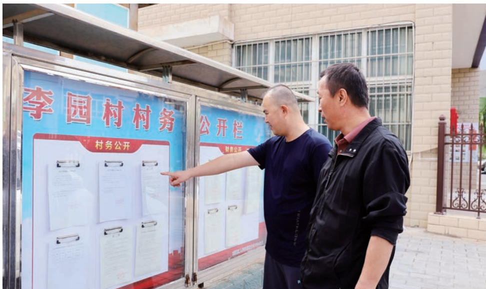
▲ 吴忠市利通区东塔寺乡李园村村民在村务公开栏前查看村务公开信息。

规范运行。创新推行“一卡一码”闭环管理体系，制定印发《关于全面推行“村务管家卡”和村集体账户收款码的通知》，明确操作规范和管理要求，已完成92个村集体账户收款码办理，为村级干部配发村务管家卡209张，实现村级零星商品采购、服务支出、经营收入等资金往来