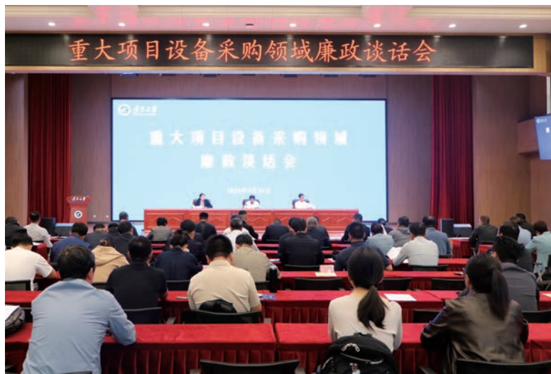
▲ 宁夏大学召开重大项目设备采购领域廉政谈话会。

将集中整治与高校领域突出问题系统整治结合起来，从基建工程、后勤管理、科研经费、招生招考、师德师风等六个方面开展系统整治。对2021年至2023年52个大项、93个小项工程建设和政府采购项目开展监督检查，发现39个问题，督促进行整改，推动完善制度、健全机制、堵塞漏洞。对招标代理机构重新遴选开展监督，提出11条监督意见；对招投标管理开展监督，推动健全责任链条、抓好关键环节、杜绝围猎腐蚀。对重大基建工程，同步开展全过程跟踪审计，增强监督合力。针对重大科研仪器设备更新项目概算资金大、廉政风险多的特点，专门召开集体廉政谈话会，学校党委书记、纪委书记共同开展廉政谈话，将监督关口前移，主体责任、监督责任同向发力、同频共振，提高监督实效。深化校园食品安全和膳食经费管理专项整治，会同市场监管部门对11个校园餐厅开展监督检查，对发现的49个问题推动整改；开展餐厅成本核算，在保证饭菜质量的前提下推动降价，102个菜品平均降价14.16%，让学生得到了实惠。加强科研经费管理，推动对各类获批的科研项目经费管理开展预警谈话。落实师德师风第一标准，组织对2个书院、4个学院开展师德师风专项巡察，督促加强管理、完善制度，推动系统施治。紧盯研究生复试等校考环节的廉洁风险，2次召开监督会议，推动排查风险、规范流程。加大案