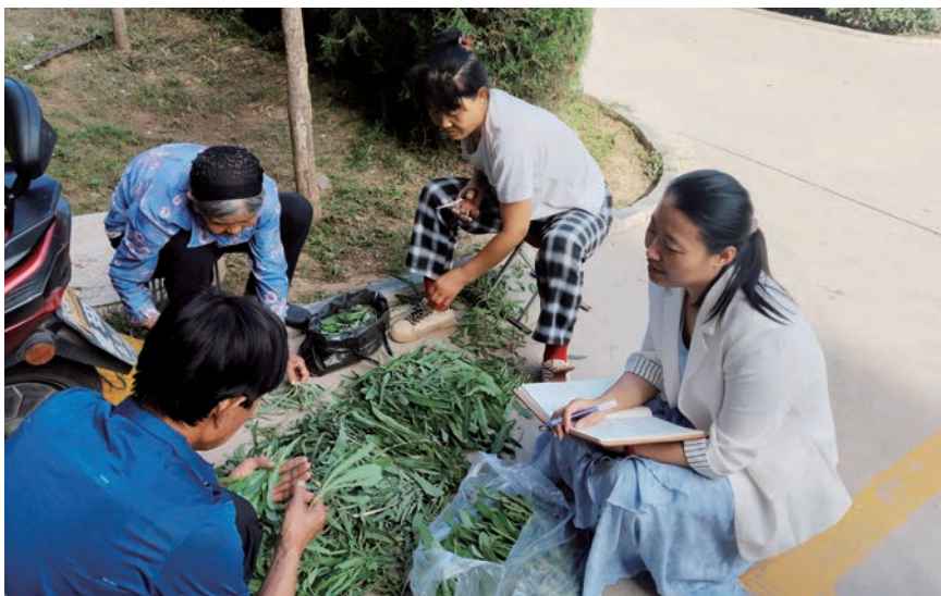
▲ 驻村队员了解居民生活、就业等情况，听取群众对社区工作意见建议。

业辅导班总是坐得满满当当。由于父母文化水平较低、教育观念陈旧，再加上要外出务工无法照顾，就只能将孩子放到社区写作业。相比身边的大多数孩子，这些花朵还需要开阔眼界、培养兴趣，这也是我们要努力的方向。