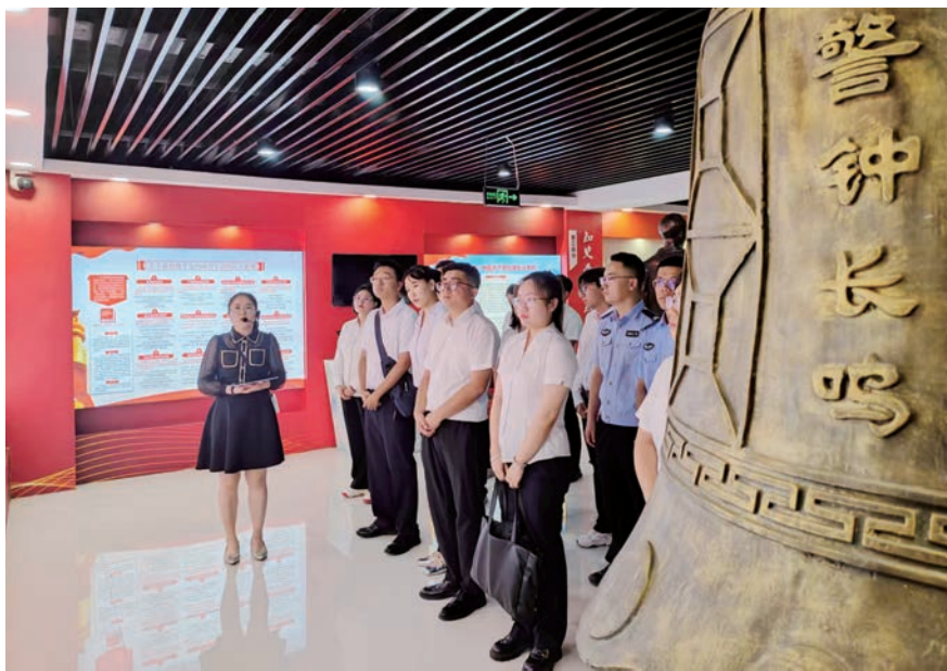
▲ 盐池县组织新入职公务员接受廉政警示教育。

教育，扣好“两新”干部廉洁从政“第一粒扣子”，通过组织新入职和新提拔干部参加红色革命教育、开展廉政警示教育活动等，引导党员干部知敬畏、存戒惧、守底线，牢固树立“不踩红线、不碰底线、不闯雷区”的思想自觉和行动自觉。今年以来，全县累计依托红色教育基地组织开展警示教育、“道情传理论”等特色活动70余场次，覆盖