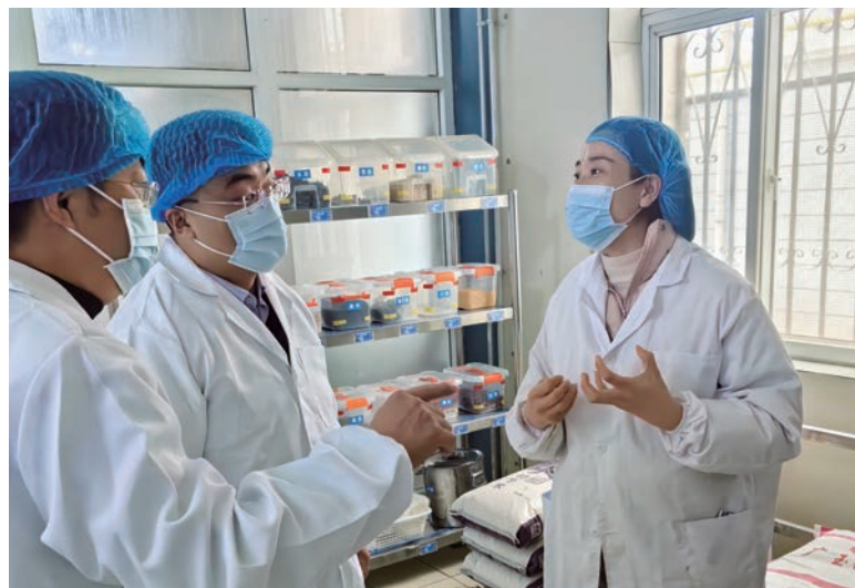
▲ 金凤区纪委监委主要负责同志调研督导锦绣苑幼儿园“校园餐”工作。

自治区纪委十三届四次全会强调，要“纵深推进纪检监察工作规范化法治化正规化建设”。金凤区纪委监委坚持严管厚爱、激励约束